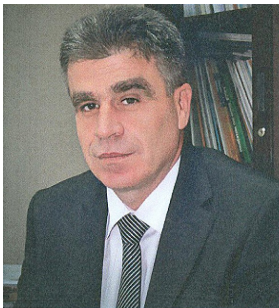
Kryeshefi i Agjencisë së Statistikave të Kosovës

Prandaj, për të gjithë shfrytëzuesit e të dhënave, këto janë të dhënat e fundit zyrtare, të vlerësuara për numrin e popullsisë së Kosovës në nivel të komunave për vitin 2013.